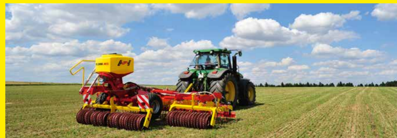
1 В сочетании с пневматическим высевающим устройством PS компании APV.